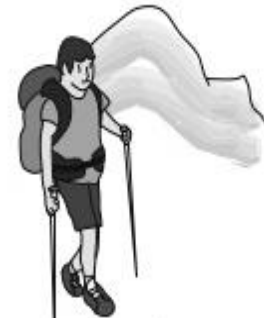
subir el cerro

3. Dibuja hábitos saludables que tú puedas realizar en tu casa.