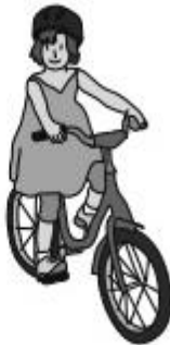
andar en bicicleta