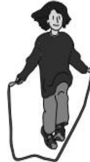
saltar la cuerda