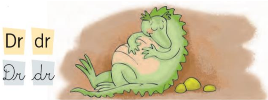
El dragón duerme.

I.- Lee las oraciones y escribe el número en la ilustración correspondiente.